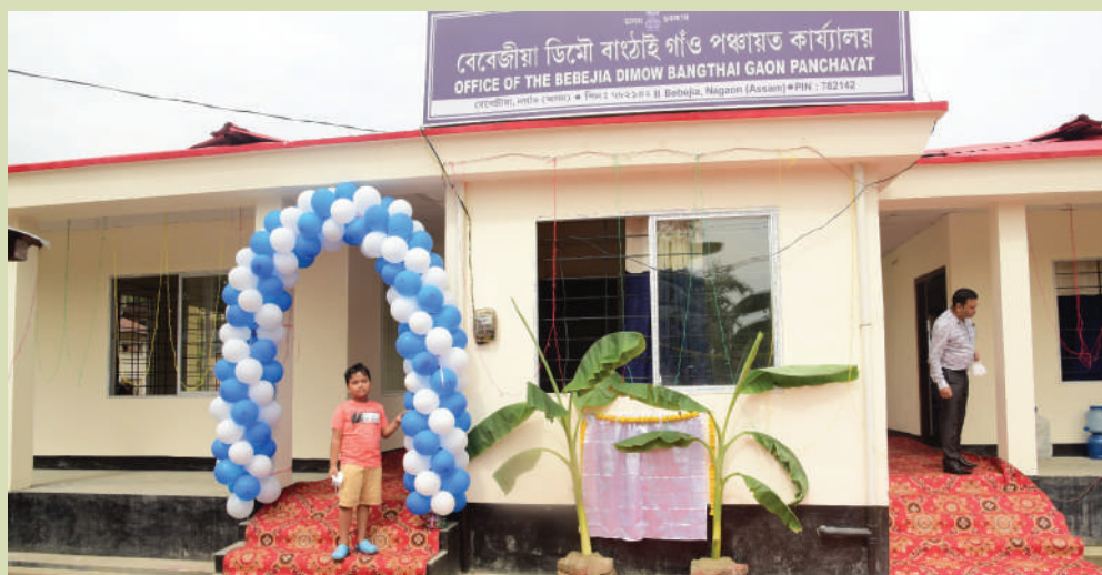
Newly constructed Gram Panchayat Bhawan at Bebejia Dimow Bangthai Gaon Panchayat