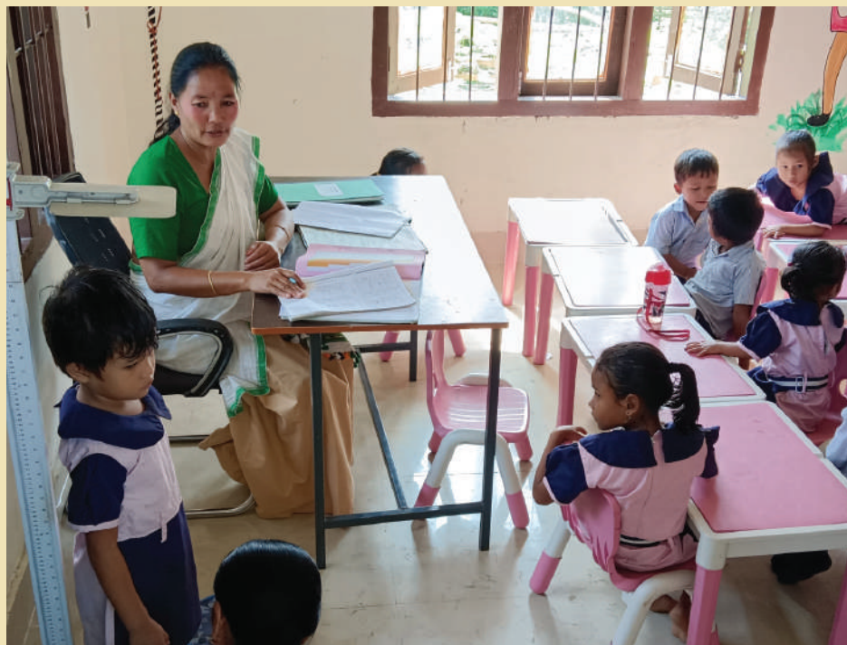
An Angadwadi centre at Jengrai Gaon Panchayat

Jengrai Gram Panchayat of Majuli district which received the first position on the theme Child-Friendly Panchayat was recognized for outstanding initiatives in improving the welfare and development of children in rural areas. This award highlights the importance of creating environments that nurture children, ensuring access to education, healthcare, and safe spaces for their growth. The key achievements of the GP are highlighted as follows: