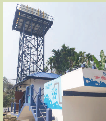
Pipe water supply under 15 th Finance Commission Scheme