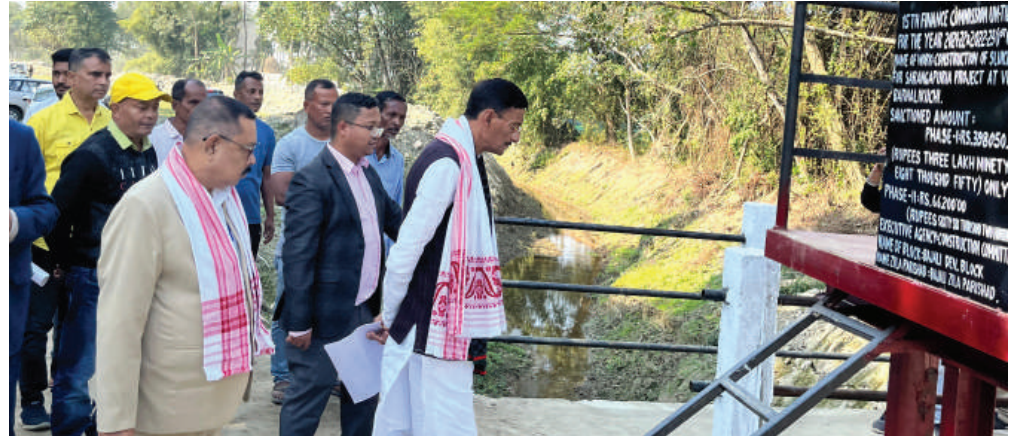
কেন্দ্ৰীয় প্ৰতিৰক্ষা ৰাজ্যিক মন্ত্ৰী সঞ্জয় শেঠ ডাঙৰীয়াই প্ৰকল্প পৰিদৰ্শনৰ সময়চোৱাত...

মূল কাৰ্য-কলাপসমূহৰ ভিতৰত পানীৰ প্ৰবাহ নিয়ন্ত্ৰণ কৰিবলৈ স্লুইচ গেট নিৰ্মাণ আৰু পানীৰ