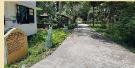
A pavers block at Bebejia Dimow Bangthai Gaon Panchayat

Jengrai Gram Panchayat under Ujani Majuli Development Block of Majuli district and Bebejia Dimow Bangthai Gaon Panchayat under Khagarijan Development Block of Nagaon District have made our state proud by receiving 1 st position in Child Friendly Panchayat and 2 nd best Panchayat Award in "Nanaji Deshmukh Sarvottam Panchayat Satat Vikas Puraskar Category respectively in the year 2023-24. In a special event held at Vigyan Bhawan, New Delhi on