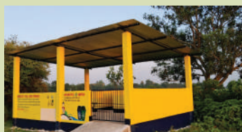
Material collection centre

In this year 2023-24 with approximately 1.94 lakh Gram Panchayats and equivalent bodies participated in the National Panchayat Awards competition. Bebejia Dimow Bangthai Gaon Panchayat under Khagarijan Development Block is awarded as 2 nd Best Gram Panchayat under "Nanaji Deshmukh Sarvottam Panchayat Satat Vikas Puraskar" in the year 2024. This National Panchayat Award was given for aggregate performance under all the 9 award themes of DDUPSVP.