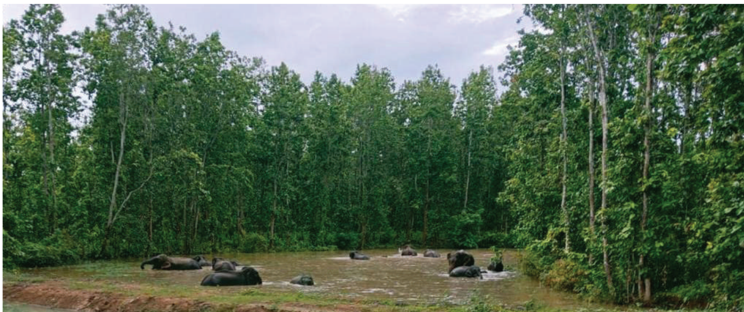
Wild elephants were earlier wreaking havoc are now seen zestfully engaging in a refreshing summer dip in one of these serene Sarovar of Rajapara.