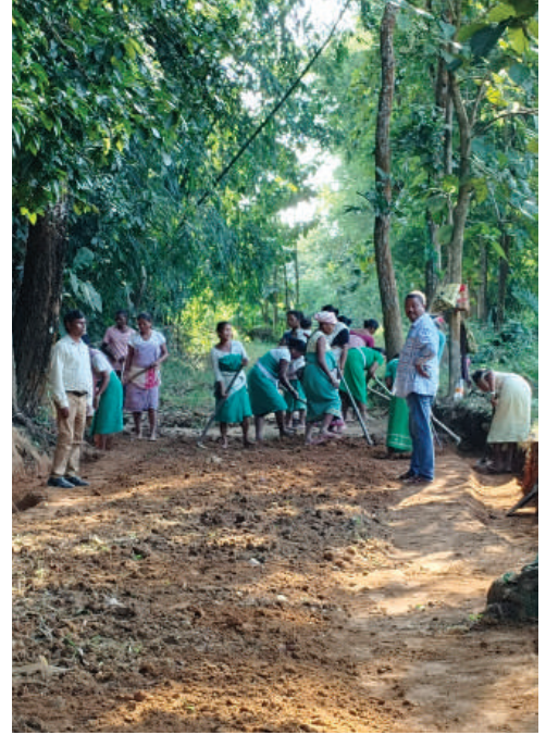
ভূমি উন্নীতকৰণ কৰ্মত ব্যস্ত মহিলাসকলৰ কৰ্মৰত মুহূৰ্ত

অসমৰ কামৰূপ জিলাৰ অন্তৰ্গত বকো উন্নয়ন খণ্ডত বৰ্তমান সেউজীয়া সৌন্দৰ্যৰে ভৰপূৰ প্ৰকৃতিৰ এক বিনন্দীয়া পৰিৱেশত নীৰৱে সূচনা হৈছে এক বিপ্লৱ। এই বিপ্লৱ সমাজ পৰিৱৰ্তনৰ বিপ্লৱ। এই বিপ্লৱে সমাজলৈ কঢ়িয়াই আনিছে এক শুভ-বাৰ্তা।