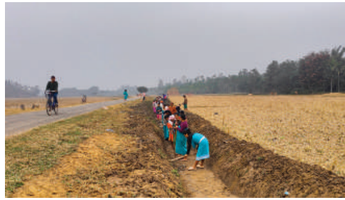
কৃষি অৰ্থনীতি অধিক ত্বৰান্বিত কৰাৰ লক্ষ্যৰে পূৰ লুকী গাঁও পঞ্চায়ত এলেকাত জৰ কাৰ্ডপ্ৰাপ্ত মহিলাসকলে নিৰ্মাণ কৰা জলসিঞ্চন খালৰ দৃশ্য

মহাত্মা গান্ধী এনৰেগা আঁচনি ৰূপায়ণৰ পূৰ্বে হাহিম আৰু চামুকা গাঁৱৰ মহিলাসকলৰ জীৱন-যাত্ৰা ঘৰুৱা কাম-কাজৰ মাজতেই সীমাবদ্ধ আছিল আৰু এওঁলোকে আৰ্থিকভাৱে স্বাৱলম্বী হোৱা কাম-কাজসমূহতো সক্ৰিয়ভাৱে অংশগ্ৰহণ কৰাৰ