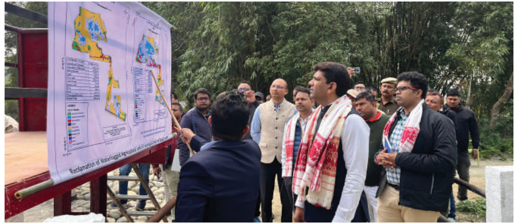
কেন্দ্ৰীয় যোগাযোগ আৰু গ্ৰামোন্নয়ন ৰাজ্যিক মন্ত্ৰী ডাঃ পেন্মাছানী চন্দ্ৰশেখৰ ডাঙৰীয়াই প্ৰকল্প বুজ লোৱাৰ মুহূৰ্তত...

গতি পথ সলনি কৰি, অতিৰিক্ত পানী নিষ্কাশন কৰাত সহায়ক হোৱাকৈ পৰম্পৰাগত খালসমূহৰ পুনৰুদ্ধাৰ কৰা, অমৃত সৰোৱৰ প্ৰকল্পৰ সৈতে একত্ৰীকৰণ কৰাৰ লগতে ভূমিৰ উৎপাদনশীলতা বৃদ্ধিৰ ব্যৱস্থা কৰা হৈছে।