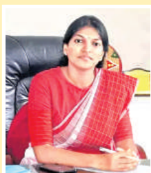
Keerthi Jalli, IAS Commissioner, PnRD