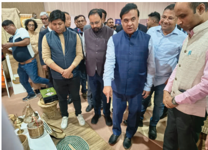
Advantage Assam 2.0: Women at the Heart of Rural Progress