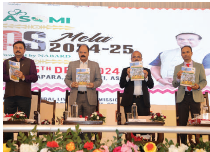
Saras Mela - The spirit of rural entrepreneurship