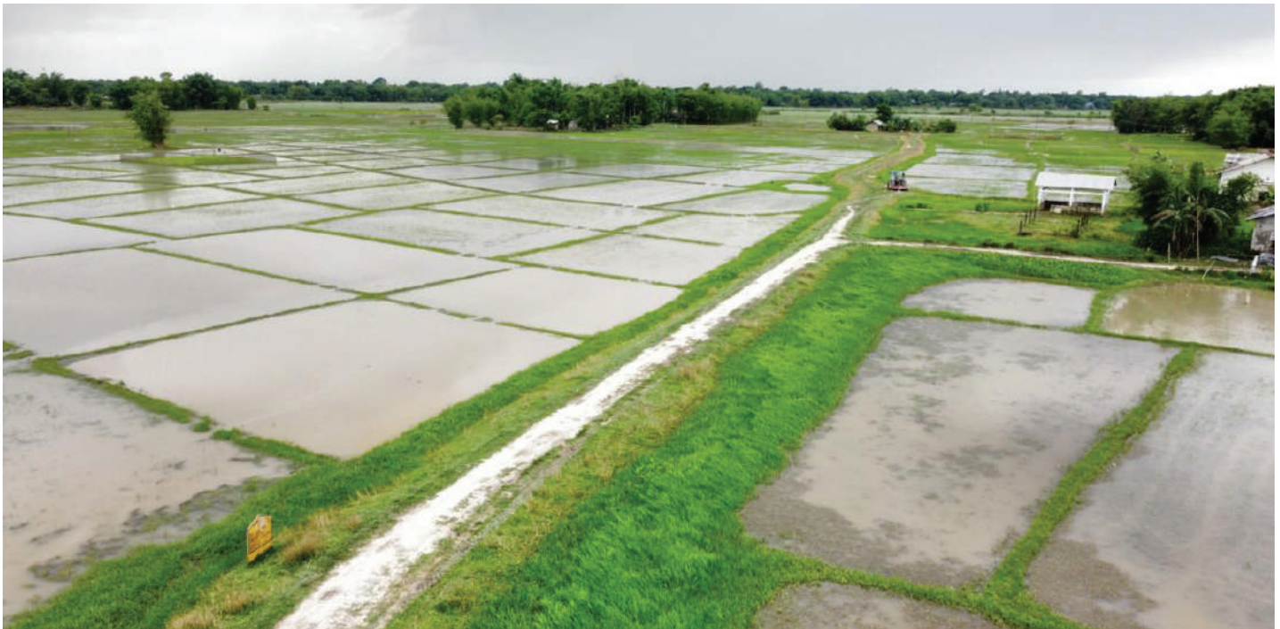
An Agri Bundh in Guijan: To protect agricultural land from floods and to improve the transportation system, this strong bundh has been constructed in Guijan Development Block of Tinsukia district under the Mahatma Gandhi NREGA scheme.