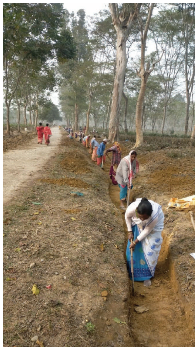
Women busy in digging the drain from Amguri Tea Estate Hospital towards Forest Gate

By resolving the persistent issue of waterlogging, this initiative has enhanced connectivity and opened up avenues for economic empowerment, particularly for women, thereby uplifting marginalised communities.