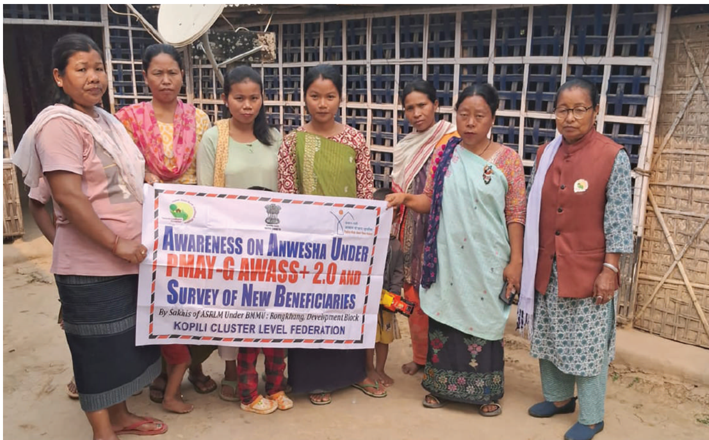
Door to door survey by Community cadres