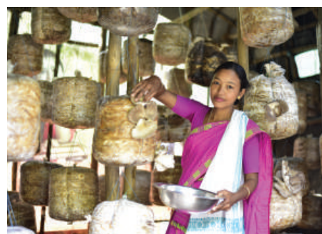
Locally Grown, Globally Inspired: Together Towards Transformation

capital subsidy worth Rs. 445.65 crore. To support vulnerable communities, 13,309 Village Organizations (VOs) have been provided with Vulnerability Reduction Fund (VRF) totalling Rs. 248.64 crore. Cumulatively, 11,841 VOs have availed Rs. 218.36 crore under this initiative. Bank credit mobilization has reached 7.58 lakh loans amounting to Rs. 17,114 crore, with a remarkable reduction in Non-Performing Asset (NPA) rates from 10.19% in FY 2018-19 to 0.90% in FY 2023-24, well below the national average of 1.58%.